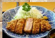
ロースカツ 定食 820円