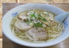
チャーシュー 麺 660円