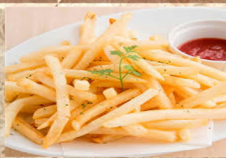
ポテト フライ 380円