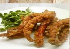
イカゲソ 揚げ 490円