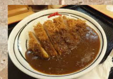
ロース カツカレー 840円