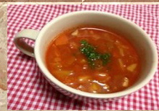
ミネスト ローネ 330円