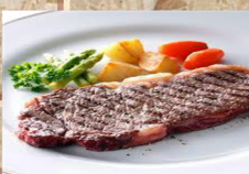
ステーキ セット 1,070円