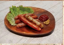
ソーセージ 盛り合わせ 520円