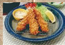
エビフライ 定食 820円