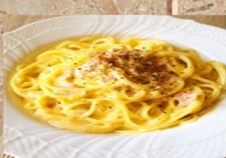
カルボ ナーラ 630円