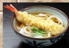
天ぷら うどん 630円