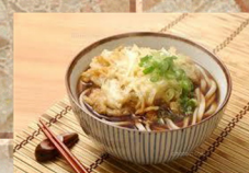
かき揚げ うどん 550円