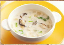
クラム チャウダー 330円