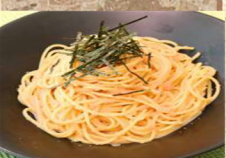
たらこ パスタ 630円