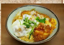
ロース カツ丼 770円